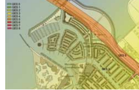
Geluid door wegverkeer in Harderwijk in 2020 Stikstof door wegverkeer in Harderwijk in 2020